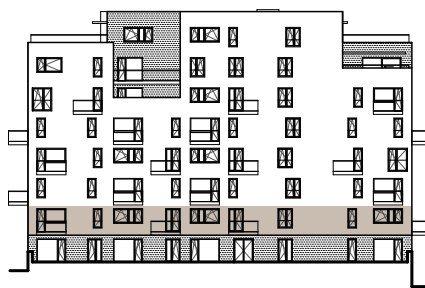
pohled na dům

Podlahová plocha bytu dle platných právních předpisů (nařízení vlády č. 366/2013 Sb.) znamená celkovou plochu všech místností bytu a také plochy pod nosnými i nenosnými zdmi, přízdívkami a jádry. Jedná se o plochu, která je vymezená obvodovými zdmi bytu.