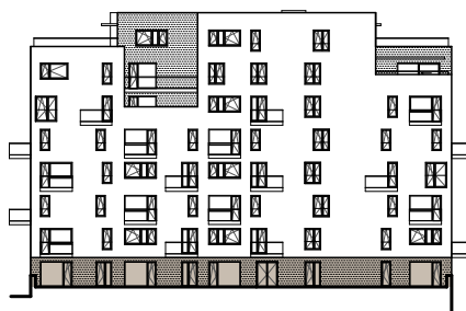
pohled na dům

Podlahová plocha bytu dle platných právních předpisů (nařízení vlády č. 366/2013 Sb.) znamená celkovou plochu všech místností bytu a také plochy pod nosnými i nenosnými zdmi, přízdívkami a jádry. Jedná se o plochu, která je vymezená obvodovými zdmi bytu.