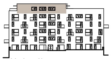
pohled na dům

Podlahová plocha bytu dle platných právních předpisů (nařízení vlády č. 366/2013 Sb.) znamená celkovou plochu všech místností bytu a také plochy pod nosnými i nenosnými zdmi, přízdívkami a jádry. Jedná se o plochu, která je vymezená obvodovými zdmi bytu.